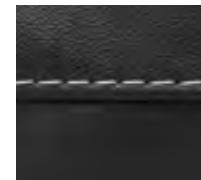
Cucitura / Stitching Cod.03

STANDARD Tessuto / Fabric Pelle / Leather